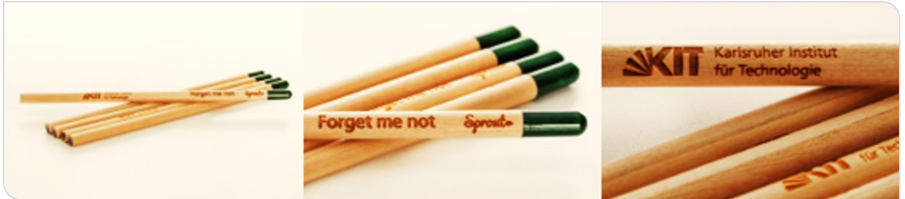
Sprout – nachhaltig produzierter Bleistift mit integrierter Samenkapsel – erhältlich im KIT-Shop